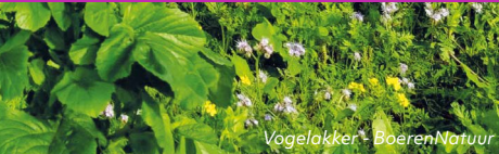
Vogelakker - BoerenNatuur

In open akkergebieden dienen vogelakkers zowel in de zomer als de winter als foerageergebied voor akkervogels. Daarnaast functioneren ze als broedhabitat, bijvoorbeeld voor patrijs, veldleeuwerik en gele kwikstaart.